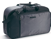
Innentasche für Touring-Topcase FJR, 50 l