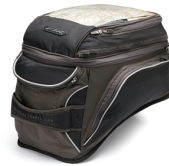
FJR Tankrucksack "Touring"