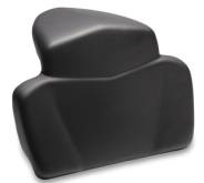
Soziusrückenlehne für Touring-Topcases

Um alle FJR1300AS Zubehörtartikel zu sehen gehen Sie auf unsere Website, oder fragen Sie Ihren Händler.