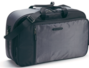
Innentasche für Touring-Topcase FJR, 50 l