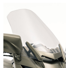
Hohe Windschutzscheibe (mit ABE)