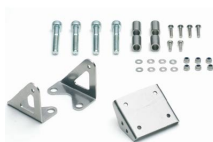
FJR Anbausatz für Navigationssystem