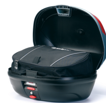
Innentasche für Topcase

Um alle FJR1300A Zubehöreffahrung zu sehen gehen Sie auf unsere Website, oder fragen Sie Ihren Händler.