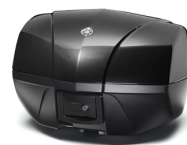
39 l Topcase "Touring"