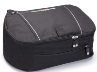
Innentasche für Topcase Touring, 39L