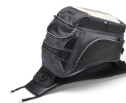
FJR Tankrucksack "Touring"